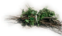
Déchets de jardin, bois (se renseigner avant)