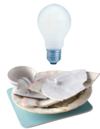
Ampoules à filaments, vitres, vaisselles cassées en petite quantité