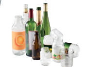
Bouteilles, bocaux, pots en verre