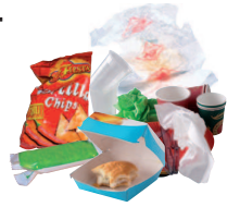
Emballages gras et sales, gobelets et couverts en plastiques