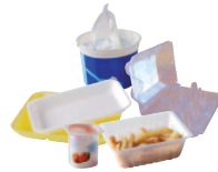
Pots de yaourt, crème, fromage blanc, barquettes en plastique et en polystyrène.