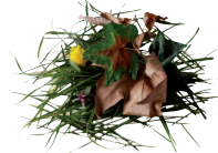
Taille de haies, petites branches, Tonte de pelouse