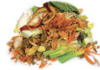
Epluchures de fruits et légumes (sauf agrumes traités)