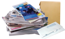
Journaux, magazines, prospectus, enveloppes