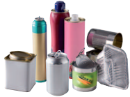
Emballages métalliques : aérosols, boîtes de conserve, canettes, barquettes et papier aluminium