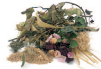
Feuilles mortes, fleurs fanées