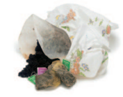
Marc de café et son filtre, Thé en sachet ou non