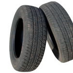
Pneus (se renseigner avant)