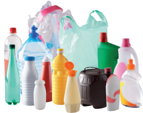
Bouteilles, flacons (avec leurs bouchons vissés dessus), sacs et films plastiques